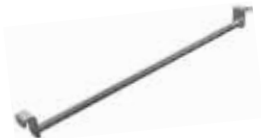
Barra de ø15 mm de acero inoxidable para colgar embutidos